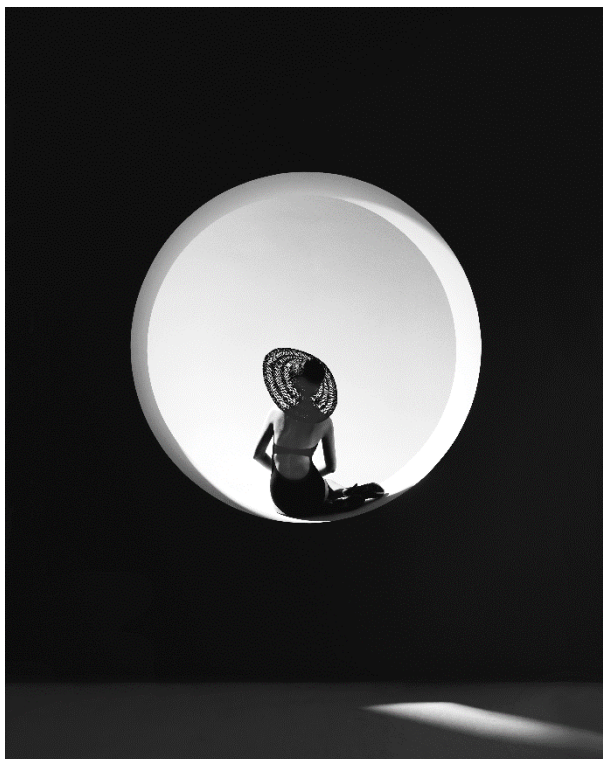
Belcor Campanya per a Vives Vidal, S.L. Sitges. Barcelona, 2010

T. 937 315 202 info@cdmt.cat www.cdm.t.cat