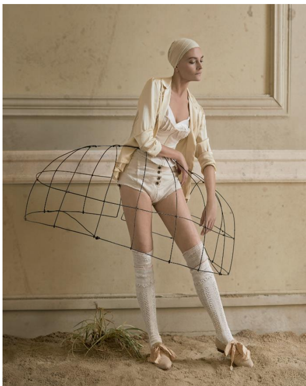
Another archive Campanya per a Little Creative Factory. Showroom LCF. Barcelona, 2020