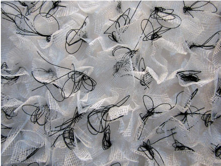
Gal·la Galona Galeta detall